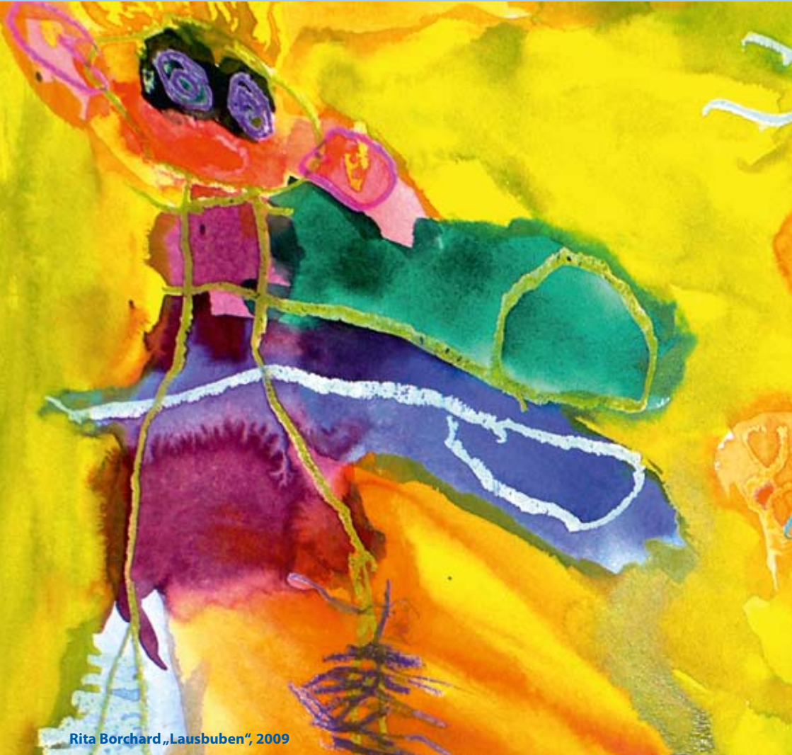
Rita Borchard „Lausbuben“, 2009